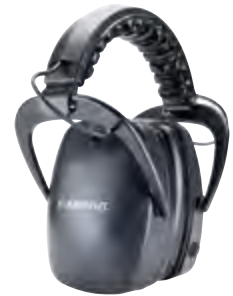
OS-400 Schallschutz Kopfhörer für ATR400 Die Schallschutz Kopfhörer besitzen einen 3,5 mm Anschluss und können z.B. mit den Albrecht ATR400 Tour Guide Empfängern verbunden werden. Sie eignen sich perfekt für die Verwendung in lauten Umgebungen, um störende Geräusche und Lärm zu reduzieren. Somit können Benutzer z.B. auf Werksführungen in Fabriken ungestört den Informationen des Reiseleiters zuhören.