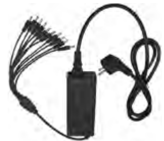
ATR / ATT 400 10-fach Ladegerät 10-fach USB-Ladekabel zur Verwendung mit Albrecht ATR 400 / ATT 400 Tourist Guide-Geräten. Mit dem starken Netzteil können bis zu 10 Albrecht Tourist Guide-Geräte gleichzeitig geladen werden. Die Ladezeit beträgt ca. 3-4 Stunden.