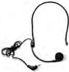
Nackenburgel-Mikrofon für ATT 400 Sendegerät Kabellänge: 100 cm