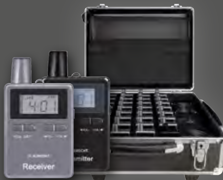
Albrecht 40er Set ATR / ATT 400, Tourist Guide Trolley Ladekoffer