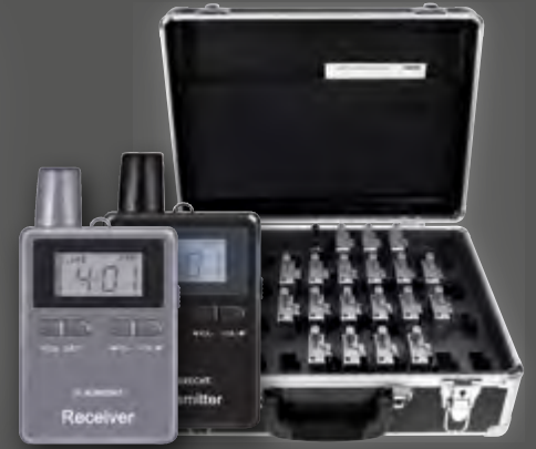
Albrecht 20er Set ATR / ATT 400, Tourist Guide Ladekoffer