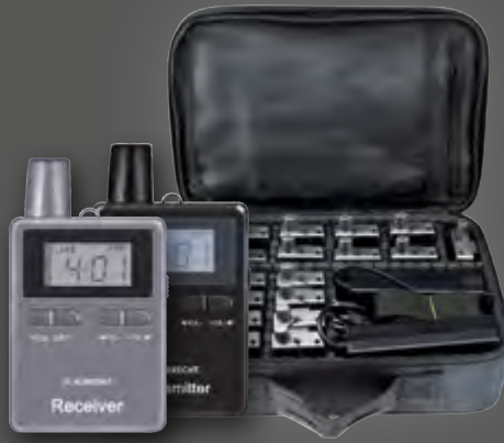
Albrecht 20er Set ATR / ATT 400, Tourist Guide Umhängetasche