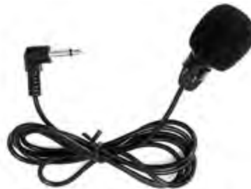
Clip Mikrofon für ATT400 Sender Clip Mikrofon für ATT400 Tourist Guide Sendegeräte zur einfachen Befestigung am Kragen, Bluse, Hemd, etc.