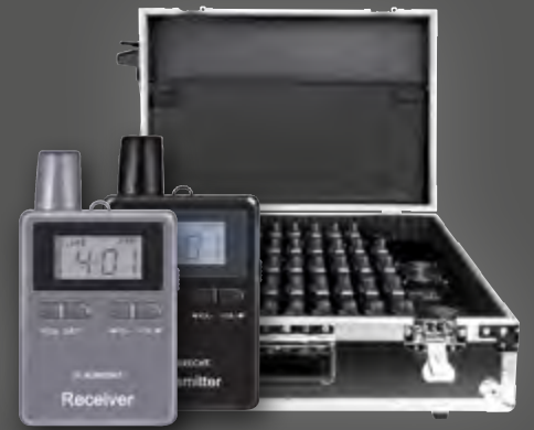
Albrecht 60er Set ATR / ATT 400, Tourist Guide Trolley Ladekoffer