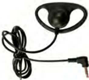
Albrecht EHE01 flexibler Ohrhörer Mono-Ohrhörer zur einfachen Befestigung an der Ohrmuschel. 3,5 mm Anschluss für ATR 400 Tourist Guide.