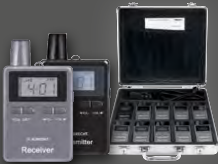
Albrecht 10er Set ATR / ATT 400, Tourist Guide Kofferset