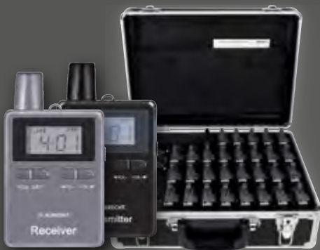
Albrecht 30er Set ATR / ATT 400, Tourist Guide Ladekoffer